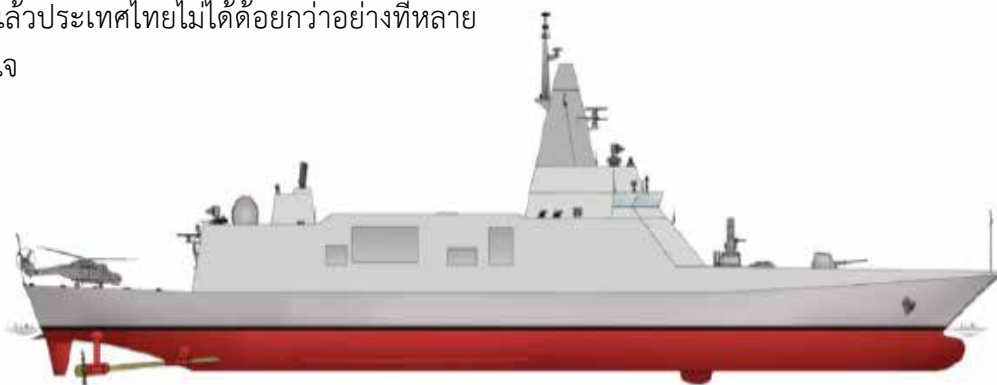
รูปที่ 4 แสดง Outboard Profile ของเรือฟริเกต

ลักษณะของเรือฟริเกตตามรูปที่ 4 มีระวางขับน้ำกว่า 3,700 ตัน ความยาวตลอดลำ 123 เมตร กินน้ำลึกประมาณ 8 เมตร ความเร็วสูงสุด 30 น็อต รัศมีทำการ 4,000 ไมล์ทะเล ระบบขับเคลื่อนประกอบด้วยเครื่องยนต์แก๊สเทอร์ไบน์ 1 เครื่องและเครื่องยนต์ดีเซล 2 เครื่อง เครื่องกำเนิดกำเนิดไฟฟ้าจำนวน 4 เครื่อง ระบบไฟฟ้าเป็นแบบ 440 V 3 Phase 60 Hz รายละเอียดตามตารางที่ 1