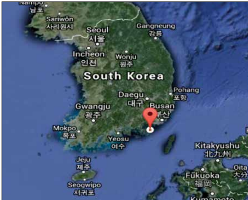
รูปที่ 1 แสดงที่ตั้งของอยู่ DSME