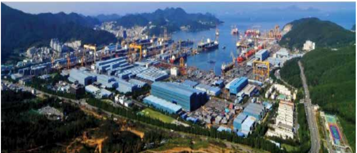
รูปที่ 2 แสดงบริเวณพื้นที่อู่ DSME

ในช่วง 2 วันแรก DSME นำเราทั้งหมดรวมทั้งเจ้าหน้าที่ชาวต่างชาติที่มาทำงานในอู่เข้าฟังเรื่อง Safety System DSME ให้ความสำคัญในเรื่องนี้เป็นอย่างมาก จากนั้นก็พานั่งรถชมพื้นที่ภายในอู่ตามรูปที่ 2 และรูปที่ 3 ทำให้ได้เห็นโรงประกอบบล็อก เกรน และ อู่แห้ง ขนาดใหญ่มหึมา ได้เห็น