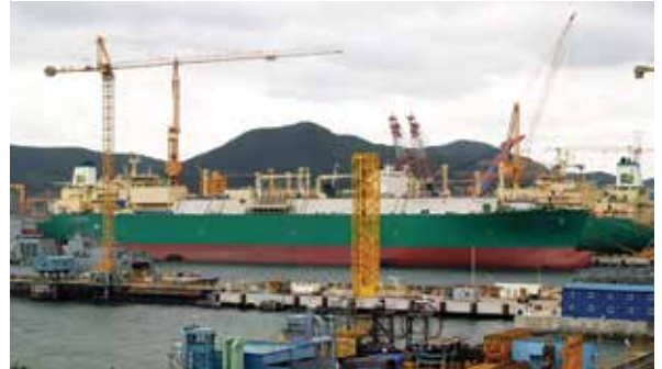
รูปที่ 3 แสดงพื้นที่ภายในอยู่ DSME

เรือฟริเกตของกองทัพเรือลำนี้จะเป็นเรือลำแรกที่กองทัพเรือได้ว่าจ้างให้สร้างที่ DSME และเป็นครั้งแรกในสาธารณรัฐเกาหลี ซึ่งเป็นประเทศที่ 3 ในภูมิภาคเอเชีย เพราะที่ผ่านมาเรือที่สร้างจากประเทศในภูมิภาคนี้เป็นเรือที่สร้างจากสาธารณรัฐประชาชนจีนและสิงคโปร์