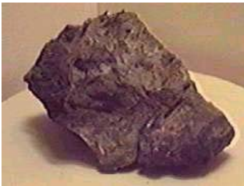
A chunk of Ambergris found in a sperm whale's intestine.

ปลาวาฬเพอร์มส่วนใหญ่จะชอบอยู่ในน้ำเย็นมากกว่าน้ำอุ่น มักพบในทะเลทางด้านเหนือและใต้ของโลกซึ่งมีอากาศหนาว และเชื่อกันว่ามันจะไม่แฉะเวียนกันมาถึงบริเวณเส้นศูนย์สูตรซึ่งมีอากาศร้อนกว่ามาก ดังนั้น ปลาวาฬเพอร์มทางทะเลอาร์คติก (ขั้วโลกเหนือ) จะเป็นคนละลายพันธุกับทางทะเลแถบแอนตาร์คติก (ขั้วโลกใต้)