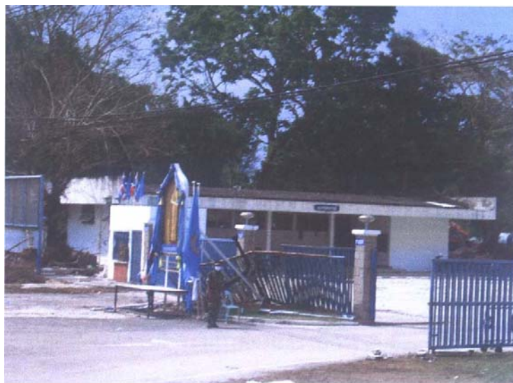
ประตูทางเข้าฐานทัพเรือพังงา

๕ - ๖ มกราคม ๒๕๔๘ สองวันนี้ภารกิจของพวกเราเป็นการช่วยเหลือในด้านการบริจาคสิ่งของให้แก่ผู้ประสบภัยซึ่งบางพวกได้ย้ายหนีไปอยู่บนภูเขา ต้องขอขอบคุณองค์การบริหารส่วนตำบลกมลาที่นำพาพวกเราไปพบผู้ประสบภัยเหล่านี้ การจัดหาที่อยู่อาศัยชั่วคราวให้แก่ราษฎรกลุ่มนี้เป็นความเร่งด่วนที่จะต้องให้การช่วยเหลือต่อไป