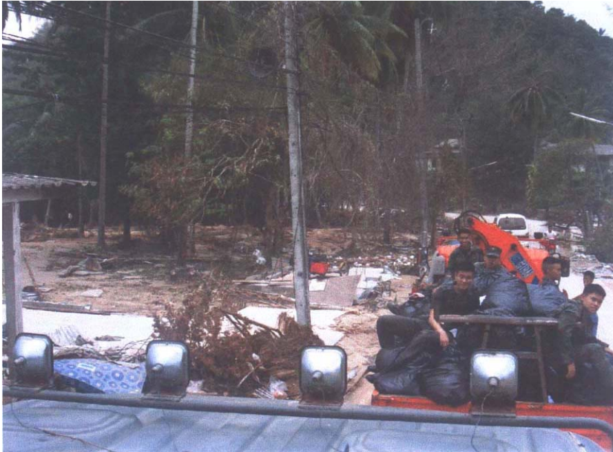
บริเวณตำบลเชิงทะเลซึ่งได้รับความเสียหายทั้งตำบล

ในตอนบ่าย ทุกคนของเข้าที่พัก ณ โรงเรียนเฉลิมพระเกียรติศรีนครินทร์ ใกล้กับบ้านพักข้าราชการกองเรือภาคที่ ๓ แต่ละคนกางเต็นท์ บริเวณสนามฟุตบอลของโรงเรียน